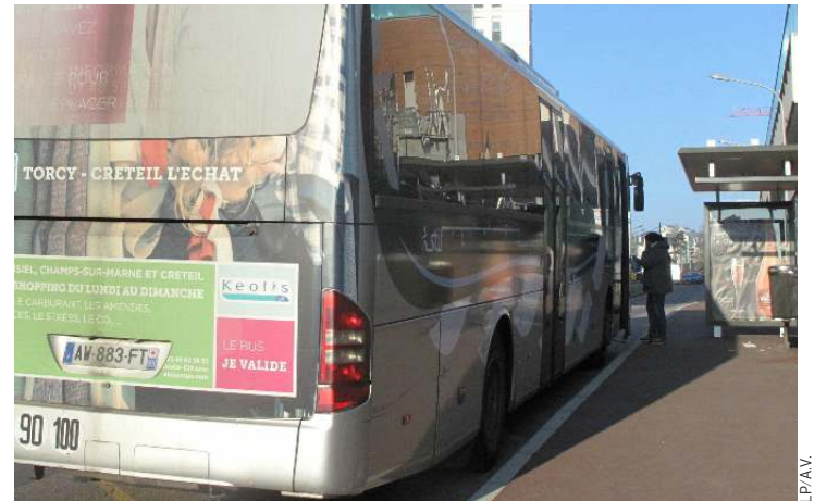
Créteil, jeudi. La ligne 100 express dessert un territoire de 72 000 habitants.

Pour le Stif et l'exploitant Transdev Lys, l'objectif est d'offrir « plus de bus quand les voyageurs en ont le plus