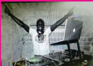
Animation DJ HYACINTHE