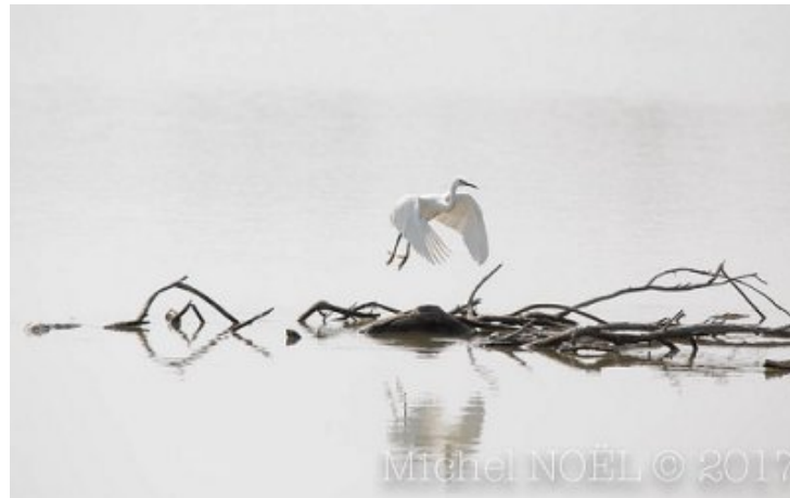
2017-7332.jpg 1 M + views.Thanks to visits https://www.flickr.com/photos/miche...