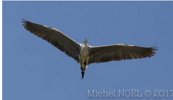
Héron cendré Ardea cinerea - Grey Heron : 2017-7062.jpg 1 M + views.Thanks to visits https://www.flickr.com/photos/miche...