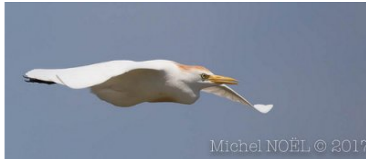
Héron garde-boeufs Bubulcus ibis - Western Cattle Egret