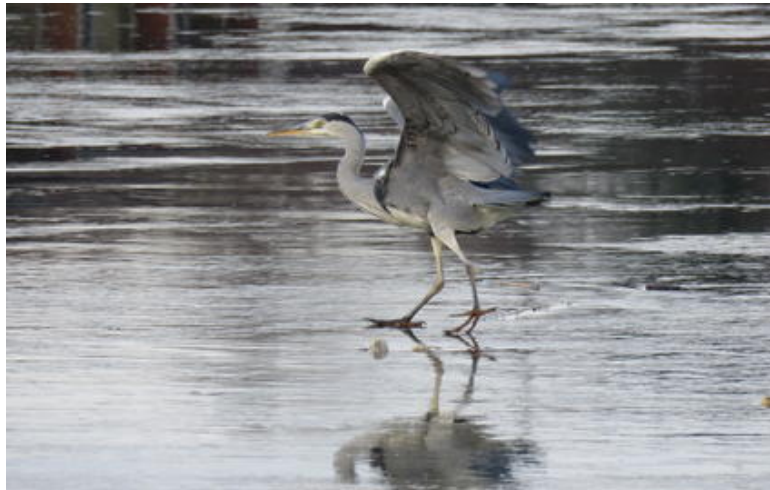
Un héron glissant sur le lac gelé