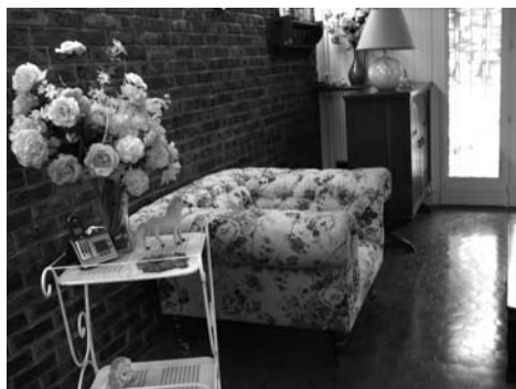
À gauche, le salon anglais.