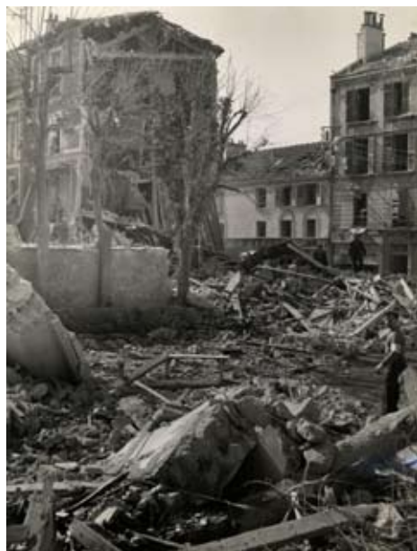
Le bombardement de Créteil

En ces temps de guerre, son rôle consiste à surveiller les champs proches de la gare de triage de Villeneuve-Saint-Georges. Les avions américains et anglais se trompent malheureusement de cible et bombardent Créteil et ses maraîchers, faisant beaucoup de dégâts et de nombreuses victimes civiles.