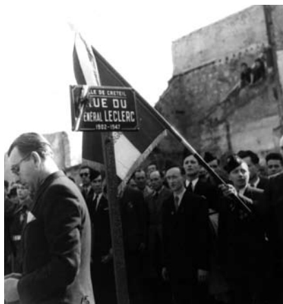
Inauguration de la rue du Général Leclerc en 1948