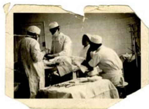
À l'hôpital des Diaconesses