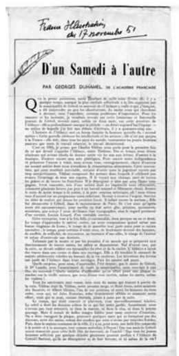
Article de Georges Duhamel (France illustration, 17 novembre 1951)