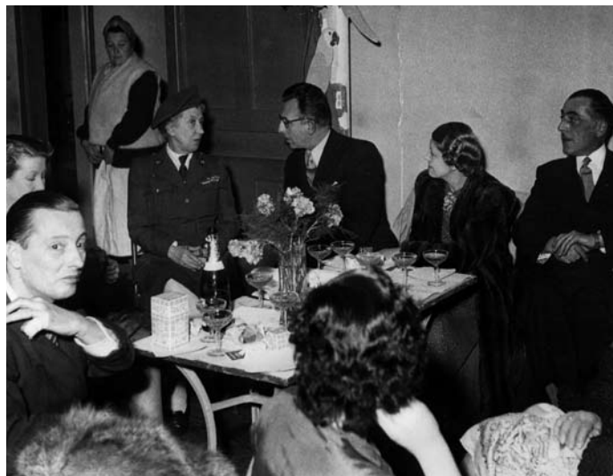
Fête de la Croix-Rouge décembre 1951