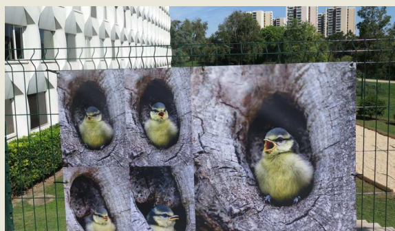
Les membres du collectif du Lac de Créteil exposent leurs photos au Novotel jusqu'au 23 octobre.

« Le Novotel est un espace grand public, ouvert, tourné vers la nature », se réjouit Michel Noël, un membre du collectif. Au fil des semaines, tous les clichés axés sur la